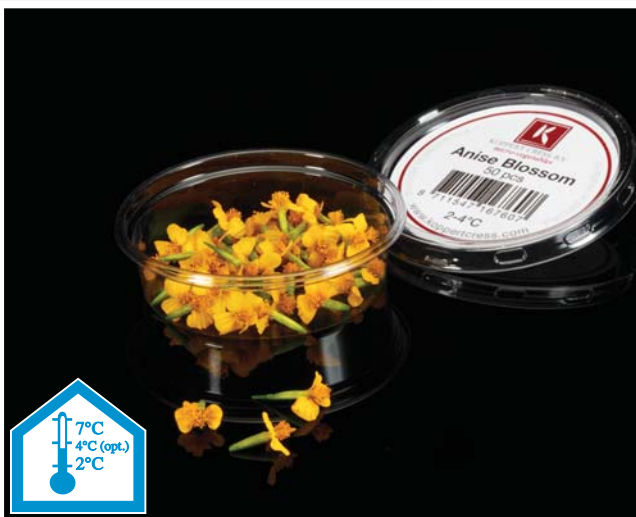
Inhoud: 50 bloemen in een cup. 4 cups per doos (20x30 cm)

Anise Blossom is jaarrond verkrijgbaar en kan tot zeven dagen bewaard worden tussen 2-7°C. Geproduceerd in een maatschappelijk verantwoorde teelt, voldoet Anise Blossom aan de hygiënische normen in de keuken. U kunt dit product direct gebruiken, want het wordt schoon en hygiënisch geteeld.