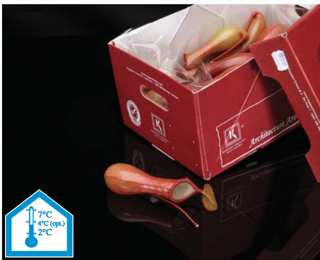
Inhoud: 25 vaasjes in een doos (20x30 cm)

De Venus Vase is jaarrond verkrijgbaar en kan tot negen dagen bewaard worden tussen 2-7°C. Geproduceerd in een maatschappelijk verantwoorde teelt, voldoet de Venus Vase aan de hygiënische normen in de keuken. U hoeft de produkten slechts af te spoelen voor gebruik, want deze worden schoon en hygiënisch geteeld. Elke vaas wordt na de oogst gereinigd en gebruiksklaar afgeleverd.